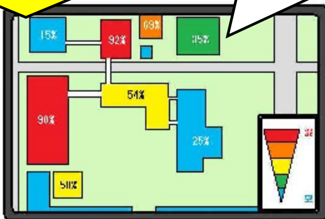
学内人口分布モニター