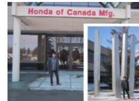
図 3 工場見学

私は語学留学での目標でも上げていましたように、車会社の工場見学をカナダで行いたいと考えていました。そこで知人やインターネットから情報を収集し、アリストンにある Honda 工場の見学を行いました。添付資料に示します ”05_1_14HistoryNo.2”は、Honda 工場とのコンタクトに使用しました資料になります。なお Honda 工場では、シビックのアセンブリラインを見学することができ、またアリストンの Honda 工場の歴史やカナダでの Honda 社員の取り組みを直接拝見できるなど、私にとって有意義な時間を過ごすことができました。