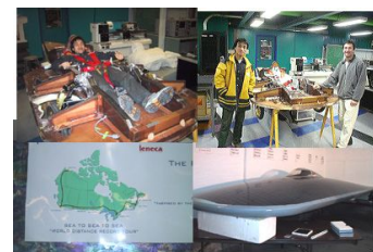
図 5 ソーラーカー見学

私は金沢工業大学のソーラーカープロジェクトに参加していたこともあり、海外のソーラーカーチームの見学を行いたいと考えていました。そこでいくつかのソーラーカーチームとのコンタクトを取り、”The Power Of One Solar Car Project” の見学を行いました。こちらのチームは、個人のチームでソーラーカーを製作しており、今年の 5 月にカナダの横断走行を計画しております。また添付資料に示します ”05_1_29KIT G.E_No.2” の資料を用いての意見交換を通して、国内の枠を超えた繋がりを持つことができました。