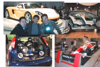
図 4 AUTO SHOW

トロントで行われた AUTO SHOW は、約 1000 台の車の展示などデトロイト、東京モーターショウに次ぐイベントになります。私はこのようなイベントに初めて参加したということもあり、車会社の種類の多さ、また車の種類や機能の多さに驚きを隠せませんでした。