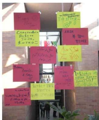
図3. いろいろな国の言葉で書かれた「あけましておめでとう」の言葉

このような、室内で過ごすイベントもありますが、外で行うイベントもありました。それは、スキー旅行です。旅行と言っても日帰りの旅行です。RITの近くにはスキー場がたくさんあり、スキーやスノーボードが盛んなようです。大学内でスノーボードをしている学生がいるくらいです。