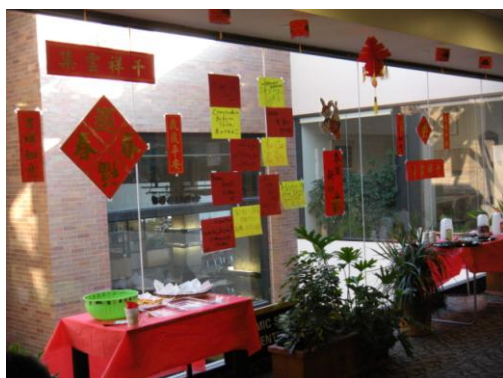
図2. パーティーの様子

夏学期は、ほぼ毎週行事がありました。しかし、秋・冬学期は2週間に1回という頻度で行事があります。夏学期は、ロチェスター市内の観光やお祭り、ナイアガラの滝の観光など、外での行事が多かったです。しかし、冬学期はボーリングや、中国の旧正月を祝うパーティーなど、室内で過ごす行事が多かったです。図2と図3に中国の旧正月を祝うパーティーの様子を示しました。