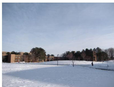
図1. 晴れの日の様子

こちらの天気はほぼ毎日どんよりとした曇りの日が多く、雪がちらついていることが多いです。また、毎日気温は氷点下なのですが、たまに気温が急に上がり雨が降ることもしばしばあります。気温の変化が激しいので体調の管理に気をつけています。今回は、ELCの行事と週末の過ごし方について報告します。