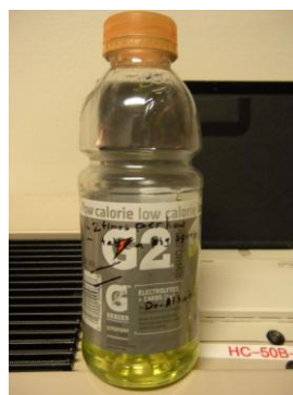
図5. 友人がくれたメッセージ