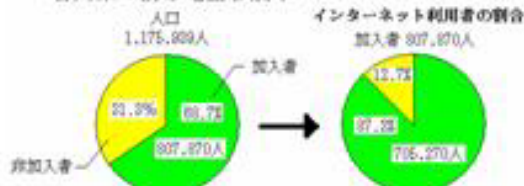
石川県の携帯電話普及率

平成16年12月末調査 http://www.dohco-ri.co.jp/press/2004/press0119-1.htm