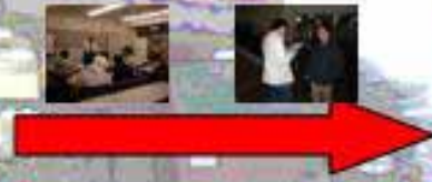
アンケート調査の結果...

目的 野々市公民館からの要望であるポスターの掲示や、パンフ配置場所およびチラシ等の整理、公民館で活動しているサークル紹介の周知方法をWebページで行い、町民に公民館のことを深く知ってもらう。